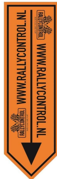
Pijl naar beneden wijzend/afsluiting