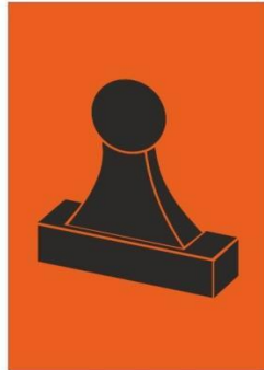
Zelfstempelaar (RC) Bemanded (RC)