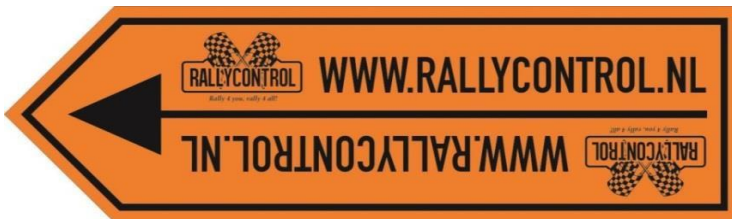
Dwangpijl (routerichting of omleiding)